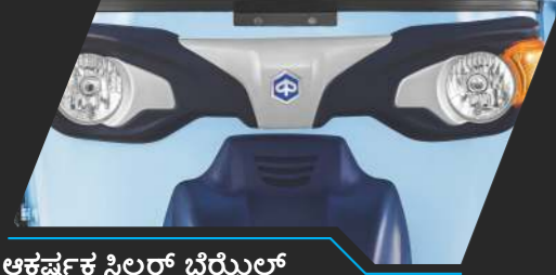
ಆಕರ್ಷಕ ಸಿಲ್ವರ್ ಬೆರೈಲ್