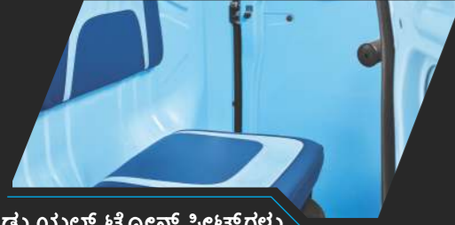
ಡ್ಯೂಯಲ್ ಟೋನ್ ಸೀಟ್‌ಗಳು